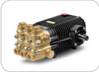
Pumpe TW Comet auf 33/300 Comet TW Pump on 33/300