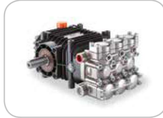
Pumpe HPP CLW auf 60/200, 75/150 HPP CLW pump on 60/200, 75/150